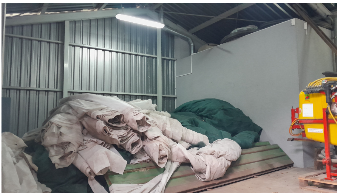
Miejsce planowanej chłodni.